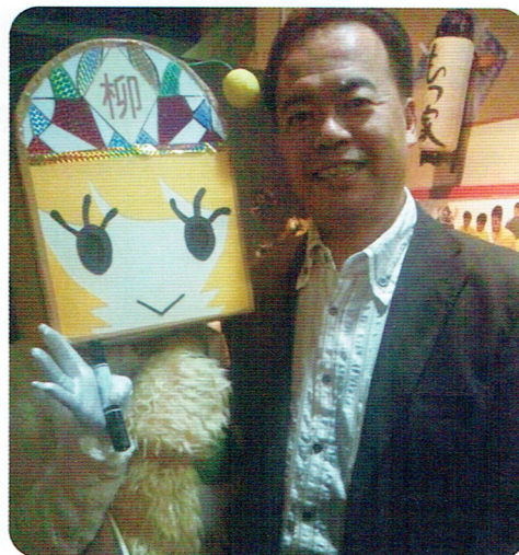
柳ヶ瀬のキャラクター「やなな」とツーショット

私の学生時代に比べて、陰湿で巧妙な手口でいじめがおこなわれているように感じます。「いじめ撲滅」に私もいろいろな取り組んでいます。学校だけの問題ではなく社会の問題として取り組む必要があると思います。